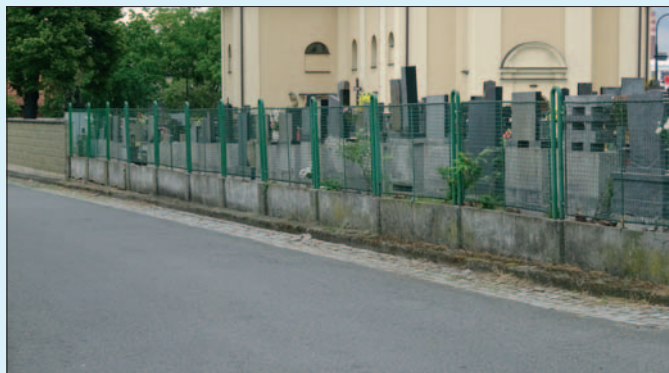
Současný stav oplocení z ul. V Mešníku

Věřím, že v letních měsících se již podaří zahájit rekonstrukci budovy č.p. 5007 (pobočka ZUŠ H. Salichové) v Třebovickém parku a plánovanou částečnou výměnu oplocení místního hřbitova. Stávající drátěný plot nahradí zděný, který naváže na již vybudovanou část hřbitovní zdi.