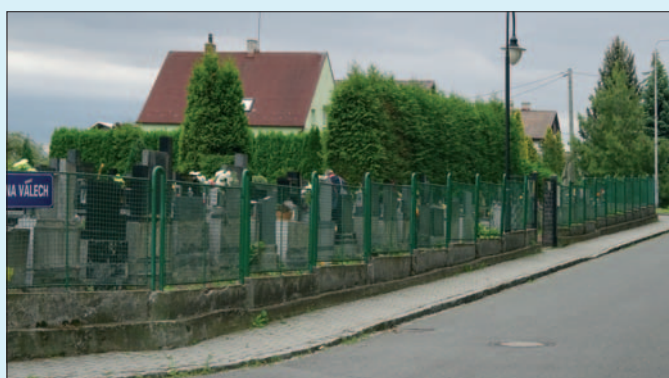
Současný stav oplocení z ul. Na Valech

Vzhledem k vyhlášenému nouzovému stavu jsme museli zrušit připravované společenské a kulturní akce. Kladení kytic k výročí osvobození Třebovic proběhlo jen za účasti omezeného počtu zaměstnanců úřadu. Pro zrušené operetní vystoupení jsme připravili náhradní termín 26. 9. 2020. Taktéž plánované společenské akce na rybníku Laša byly odvolány.