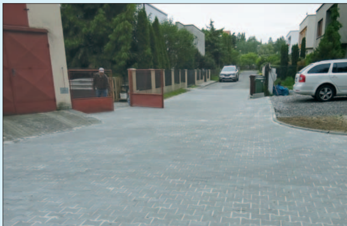
Opravený úsek komunikace ul. Na Bezděku

Částečné uvolnění situace v měsíci květnu nám umožnilo realizovat první z plánovaných oprav na komunikacích, a to opravu části ulice Na Bezděku.