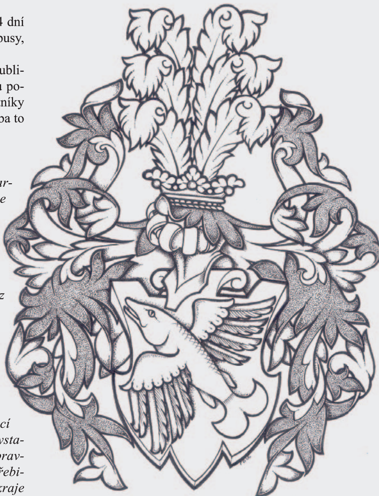
Erb rytířů Bzenců z Markvartovic