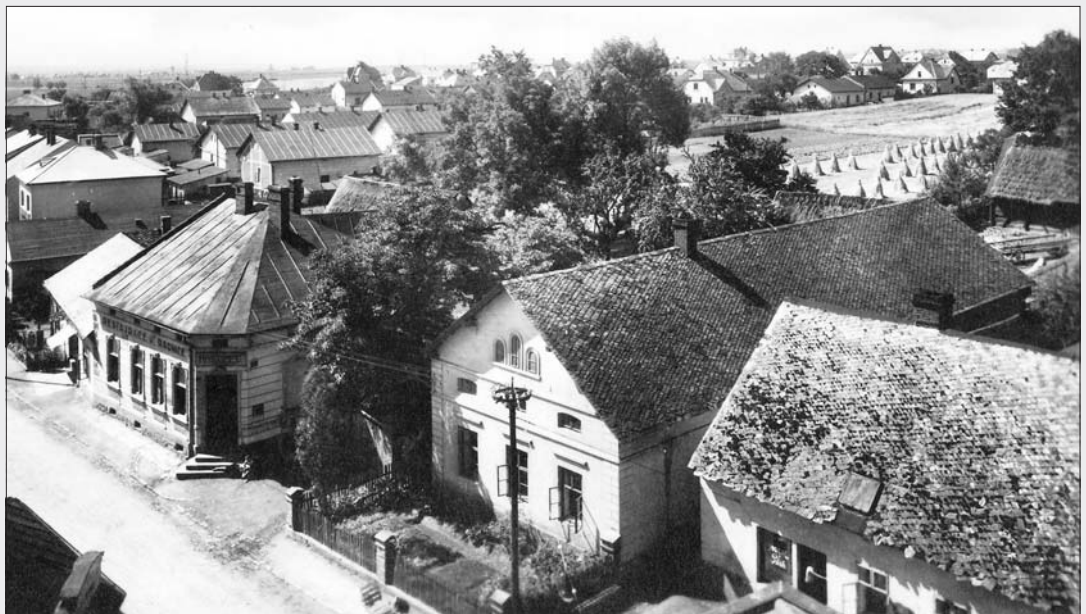
Trída 28. října – Pohled z dnešní radnice směrem k Opavské ulici, na záběru původní restaurace U Židků, Šrámkův grunt s předzahrádkou, restaurace paní Gelnarové ...

TRÍDA 28. ŘÍJNA, NÁMĚSTÍ SVOBODY, SLEZSKÁ, MASARYKOVA, NA VALECH, BEZRUCHOVA, TYRŠOVA, JUBILEJNÍ, ŠTEFÁNIKOVA, KŘÍŽKOVSKÉHO, PRASKOVA, GRUDOVA, STRATILOVA, TŮMOVA, PALACKÉHO, V MEŠNÍKU, ŠKOLNÍ, JINDŘICHA BZENICE, NÁDRAŽNÍ, POD VÝHONEM, NA HELENĚ, NA HAVRANCI. “