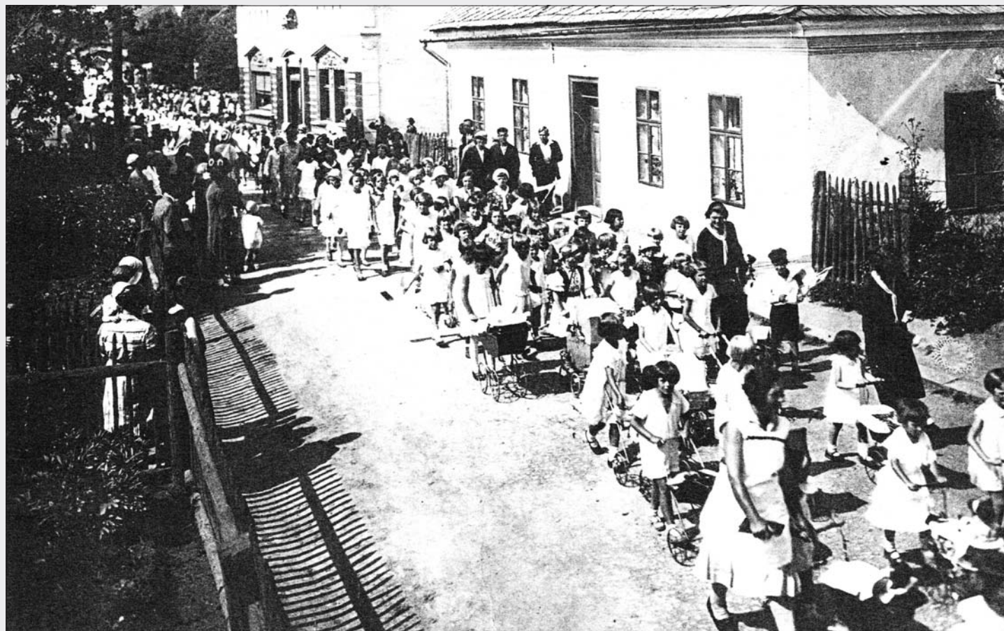
Vě slavnostním průvodu byly také děti a mládež

Jubilejní oslavy byly přerušeny obecními volbami, poznamenanými vrcholící světovou hospodářskou krizí a politickým vývojem u sousedů, kde Hitler se svou NSDAP v tomtéž roce získal volební vítězství. Výsledky obecních voleb z 12. června jsou zaznamenány v kronice: „Strana sociálně demokratická 263 hlasy - 7 mandátů, strana lidová 256 - 6, národních socialistů 154 - 4, strana křesťansko sociální 116 - 3, komunistická 85 - 2, fašistická 56 - 1, republikánská 55 - 1. Zastupitelstvo zvolilo starostou Josefa Volného, Karla Kubenku 1. náměstkem, Adolfa Tománka 2. náměstkem. Radními byli zvoleni František Gallus, Tomáš Gelnar, Augustin Šrámek, Josef Šenk a Ferdinand Lička.“ Po všech úředních povolebních úkonech se mohlo pokračovat v oslavách. „28. června v sále hostince p. Židka byla hudební a pěvecká akademie. Oslavu zahájil řídící učitel p. Tomáš Gelnar a místní kronikář A. Prokop měl přednášku o historických dokladech a vý-