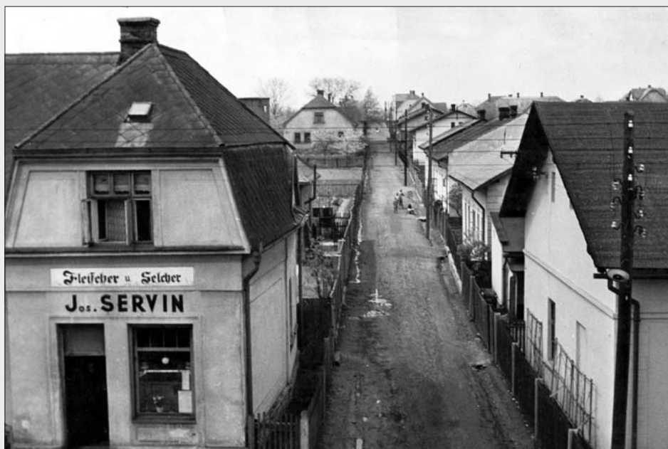
Původní Štefánikova ulice z počátku německé okupace, kdy zcela zmizely veřejné české nápisy a názvy

A následuje zápis z dalšího jednání: „ Obecní rada dala zhotovit tabulky ulic firmě Vitásek z Pustkovce. Jedna tabulka o rozměrech 560 x 290 cm stála 35 Kč. “