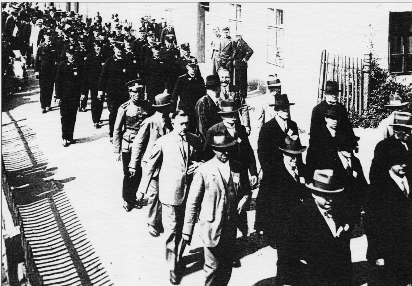
Slavnostní průvod z 29. června 1932