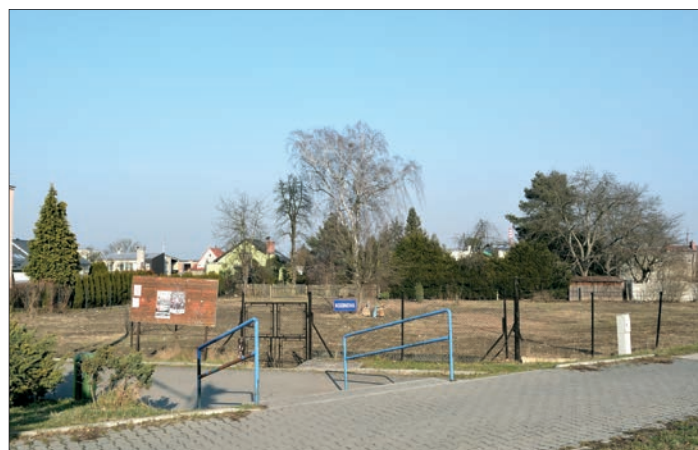
Vyčištěná plocha bývalých zahrádek Kozinova