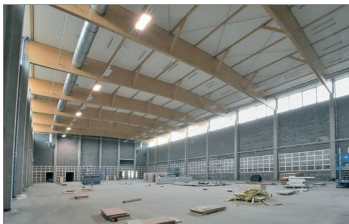
Interiér sportovní haly

Druhým místem, kde se v zimních měsících intenzivně pracovalo, byly bývalé zahrádky na ulici Kozinova. Vznikl zde poměrně rozsáhlý prostor, který bylo potřeba základním způsobem upravit, aby tady mohla být na jaře vyseta tráva. Pozemek se rozkládá v prostoru, který je významným vstupem do Třebovic a zaslouží si, aby byl jeho vzhled do doby, než se rozhodne o jeho dalším definitivním osudu, co nejhezčí. O využití pozemku se bude rozhodovat komunitním způsobem. To znamená, že bude vážně brán v potaz názor občanů a jejich představy. Důležité bude i stanovisko Městského ateliéru prostorového plánování a architektury tzv. MAPPY. V žádném případě se neuvažuje o prodeji pozemku, který by měl být v blízké budoucnosti ozdobou pomyslné brány do Třebovic, kterou ústí Kozinovy ulice bezesporu je.