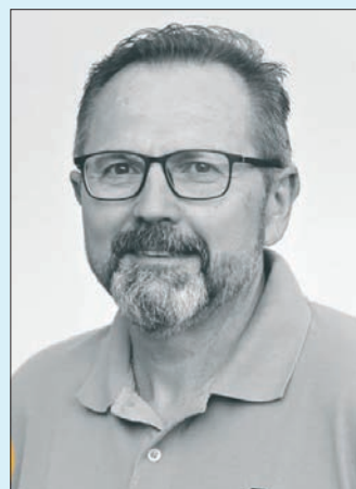
Váš starosta Jiří Volný

Přeji Vám hodně jarního sluníčka, krásné a veselé Velikonoce a vše dobré do dalších dní.