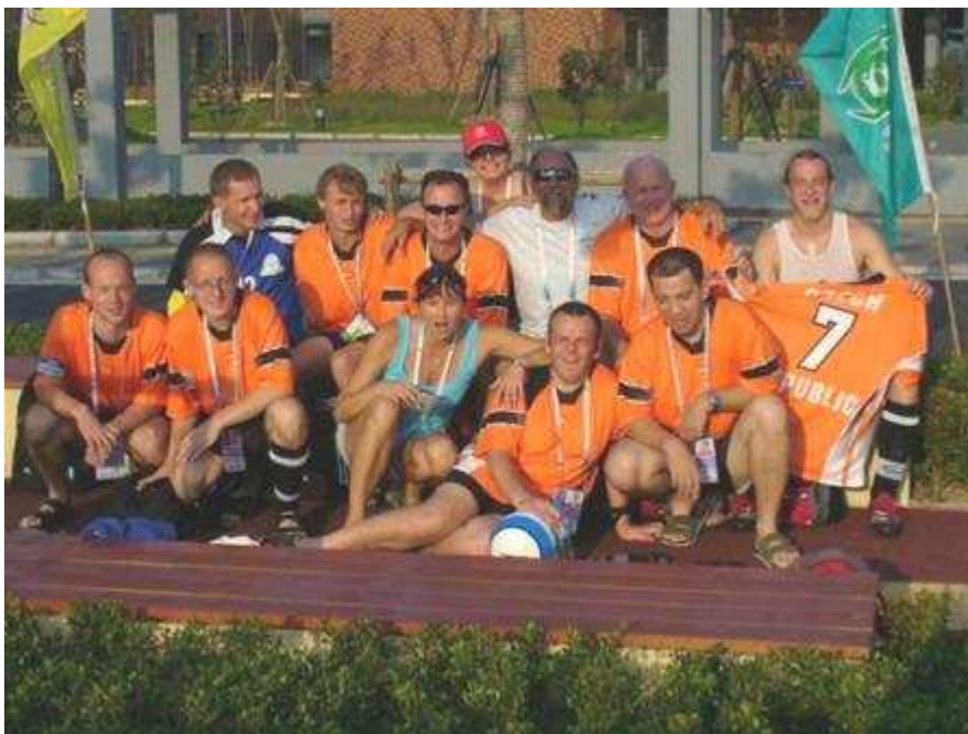
Po vítězném utkání s Čínou 8:2