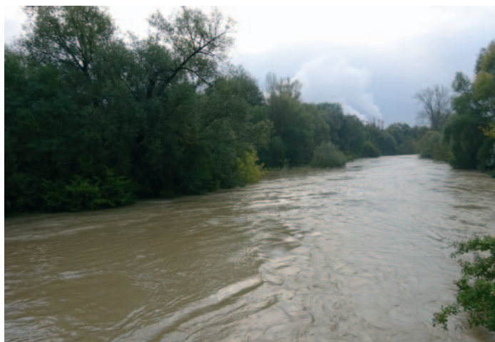
Maximální průtok u přechodové lávky