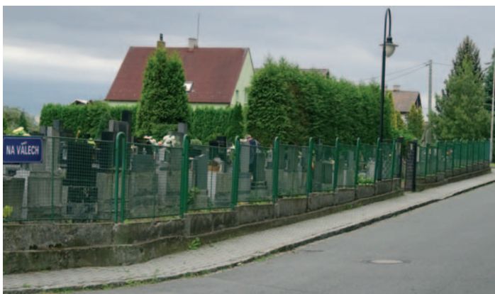
Původní oplocení hřbitova