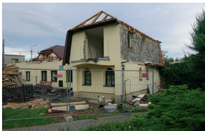
Zahájení demoličních prací