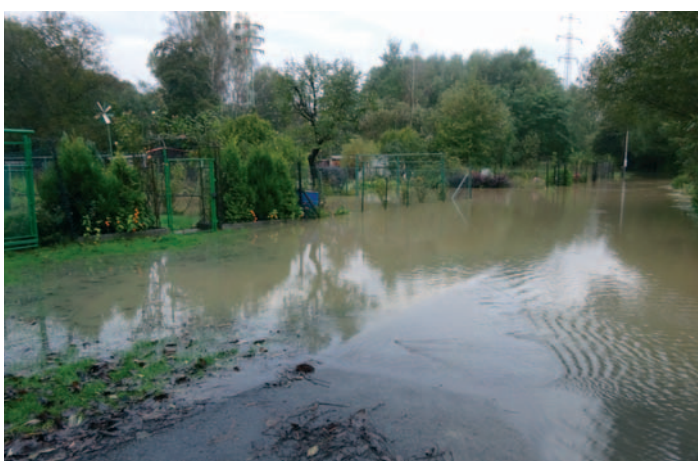
Cesta k chatám u starého splavu