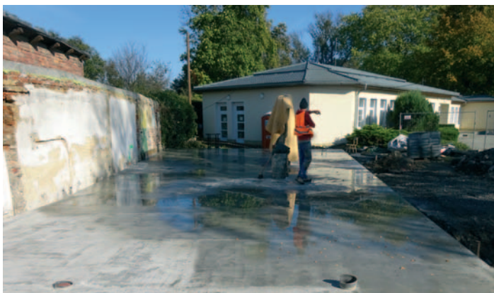
Původní stavba odstraněna