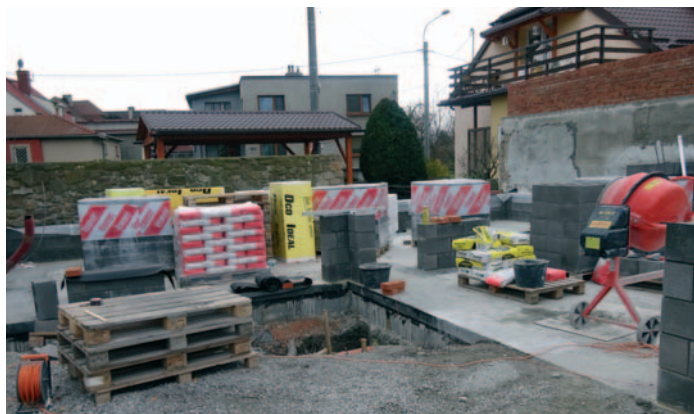
Zahájení výstavby nové budovy