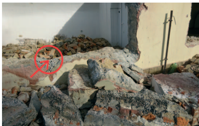
Místo nálezu skříňky s dokumentem z roku 1924