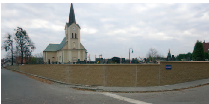
Nové oplocení včetně vstupní brány