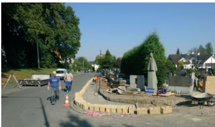
Postup výstavby nové hřbitovní zdi