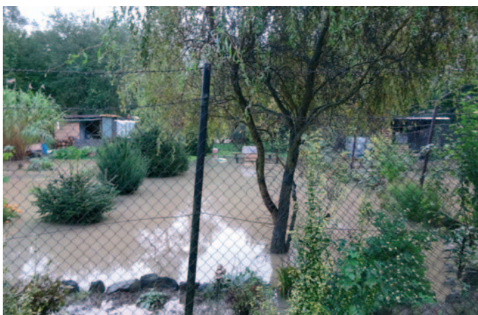
Zahrádky pod třebovickým nádražím