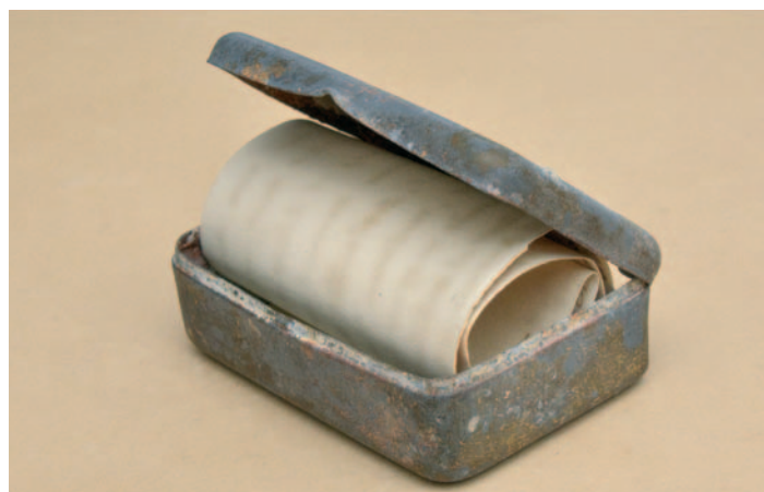
Nalezená dobová skříňka s dokumentem