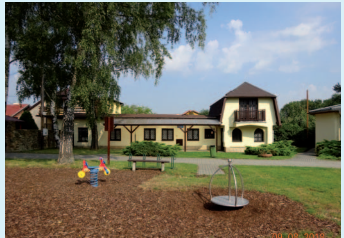
Budova č.p. 5007 v parku - současný stav