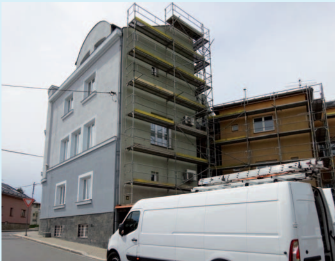
Probíhalo čištění a nátěr fasády