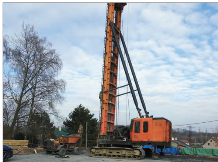
Technika pro hloubení pilotů do hloubky až 12 metrů