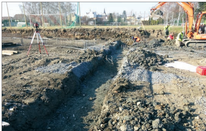
Příprava plochy pro stavbu

ho povrchu z bývalého parkoviště. Třetí a hlavní etapou založení spodní stavby byla pilotáž z důvodu nestability historického návozu na této ploše. Pro stabilizaci základové desky a celé stavby bylo nutné zabudovat do podloží 125 štěrkových pilotů do hloubky 5 až 10 m a 47 železobetonových pilotů do hloubky 12 m. Následující etapou je již vlastní stavba haly, která v březnu začala probíhat.