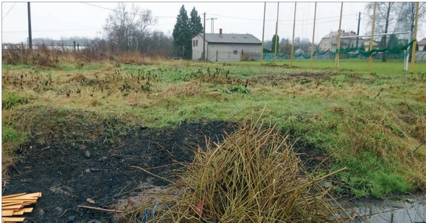
Stav před zahájením stavby