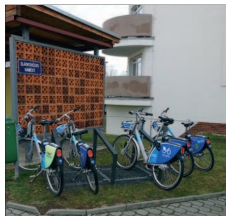
Zastávka Třebovice, Sládkovičovo náměstí

Kompletní informace, postupy, včetně mapy stanic, kde si můžete půjčit a vrátit kolo najdete na https://www.nextbikeczech.com/ostava/