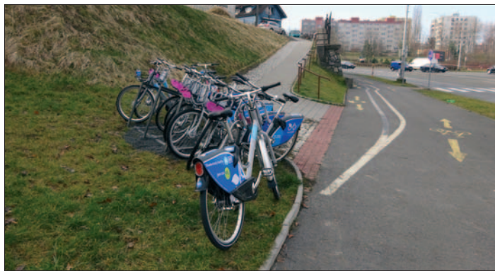
Zastávka Sokolovská, ul. Martinovská

Vzhledem k tomu, že o systém sdílených kol je mezi občany zájem, město Ostrava jej proto bude dále finančně podporovat.