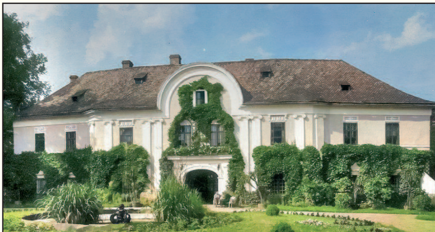
Třebovický zámek v meziválečném období

Vycházky Třebovicemi začínají nejstarší historií. Právěké osídlení na nedalekém Hladovém vrchu, nález uren kultury popelnicových polí na katastru Třebovic v roce 1910, pojmenování Třebovic. Věděli jste, že ves dostala název podle místa vytríbeného, tedy vykáceného pralesa?