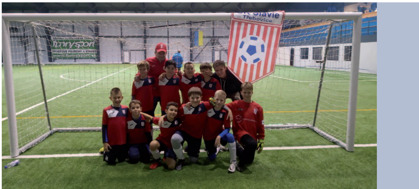
Z halového turnaje ze slovenské Korní, kde mladší žáci obsadili 4. místo z 10 týmů