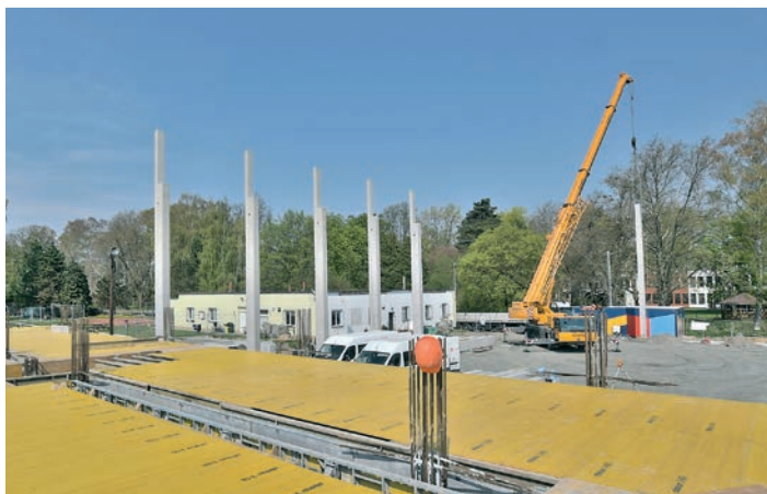
Montáž nosných sloupů