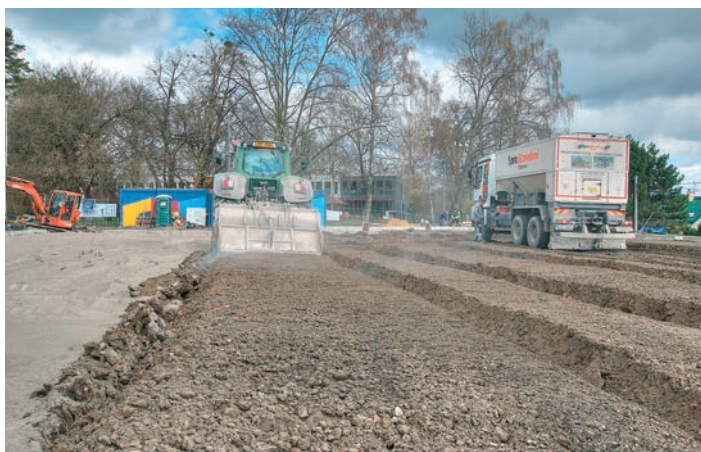
Stabilizace podloží pod halou