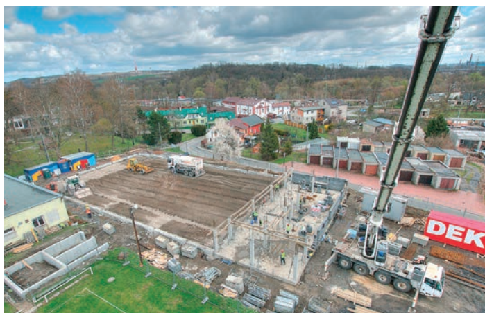
Pohled z výškového jeřábu