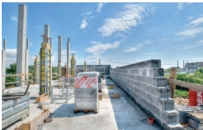
Výstavba – vrchní patro