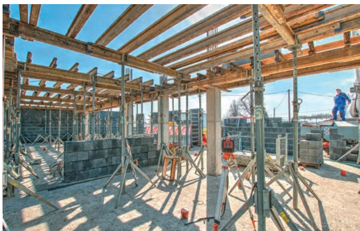
Výstavba - zázemí haly