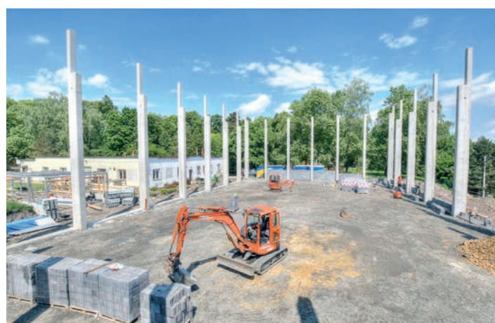
Zdění obvodového zdiva