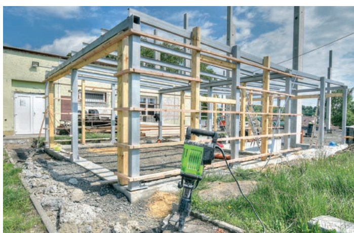
Budoucí sklad s úschovnou kol