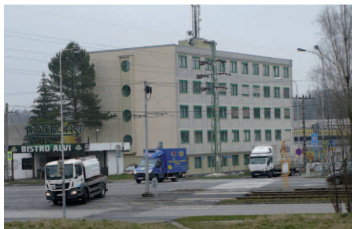
Současný stav křižovatky

Následovat budou výstavby nových tramvajových nástupišť v obou směrech, při nichž budou uzavřeny oba levé jízdní pruhy vozovky a také budou probíhat výluky spojů Dopravního podniku Ostrava, a.s. vzhledem k úpravám kolejového svršku. Práce na této křižovatce by měly být ukončeny začátkem měsíce prosince.