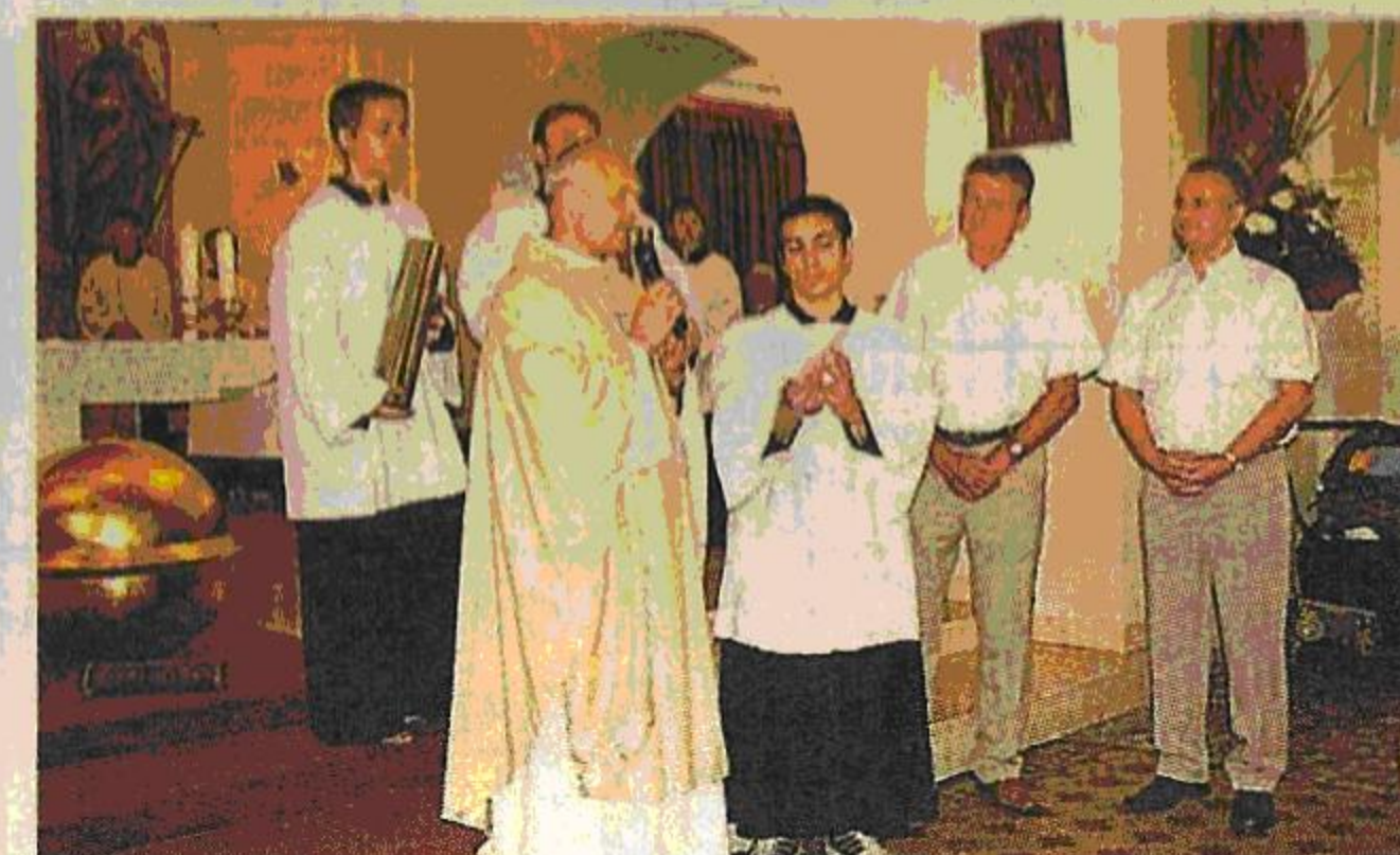
SVĚCENÍ PAMÁTNÝCH TUBUSŮ. Písemnosti byly do připravených tubusů vloženy v kostele při mši.